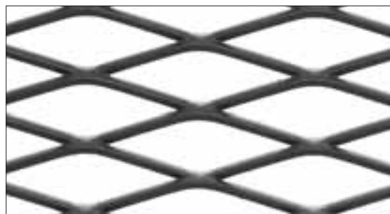
Tipo 2 - 17 - 28 - 43