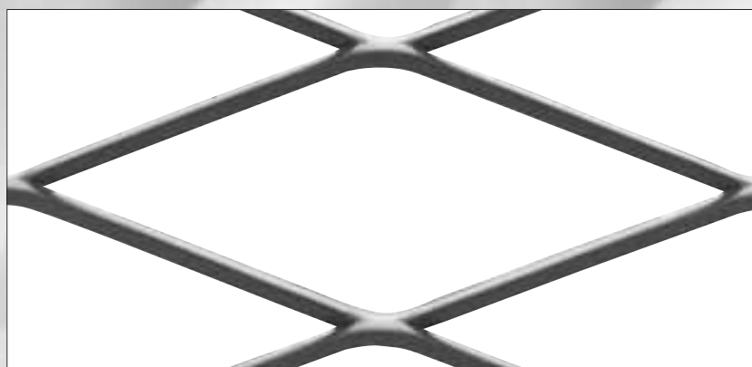
Tipo 24 - 21 - 24A