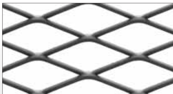
Tipo 27 - 41