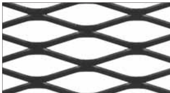
Tipo S2 - S17 - S28

Le maglie sono rappresentate al reale con le usuali tolleranze dovute alla riproduzione fotografica.